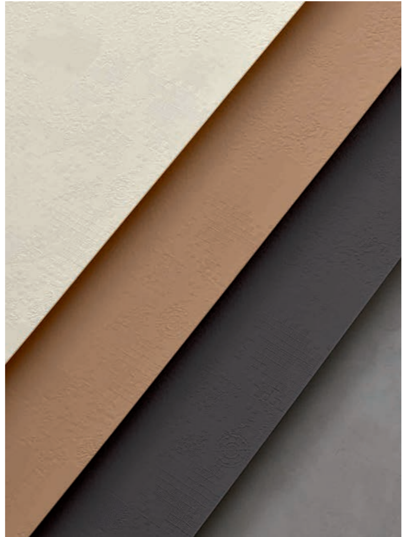
Gesso, Avana, Grafite