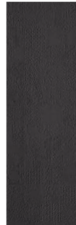
Déchirer XL Grafite * 100-300 cm * 39"-118"