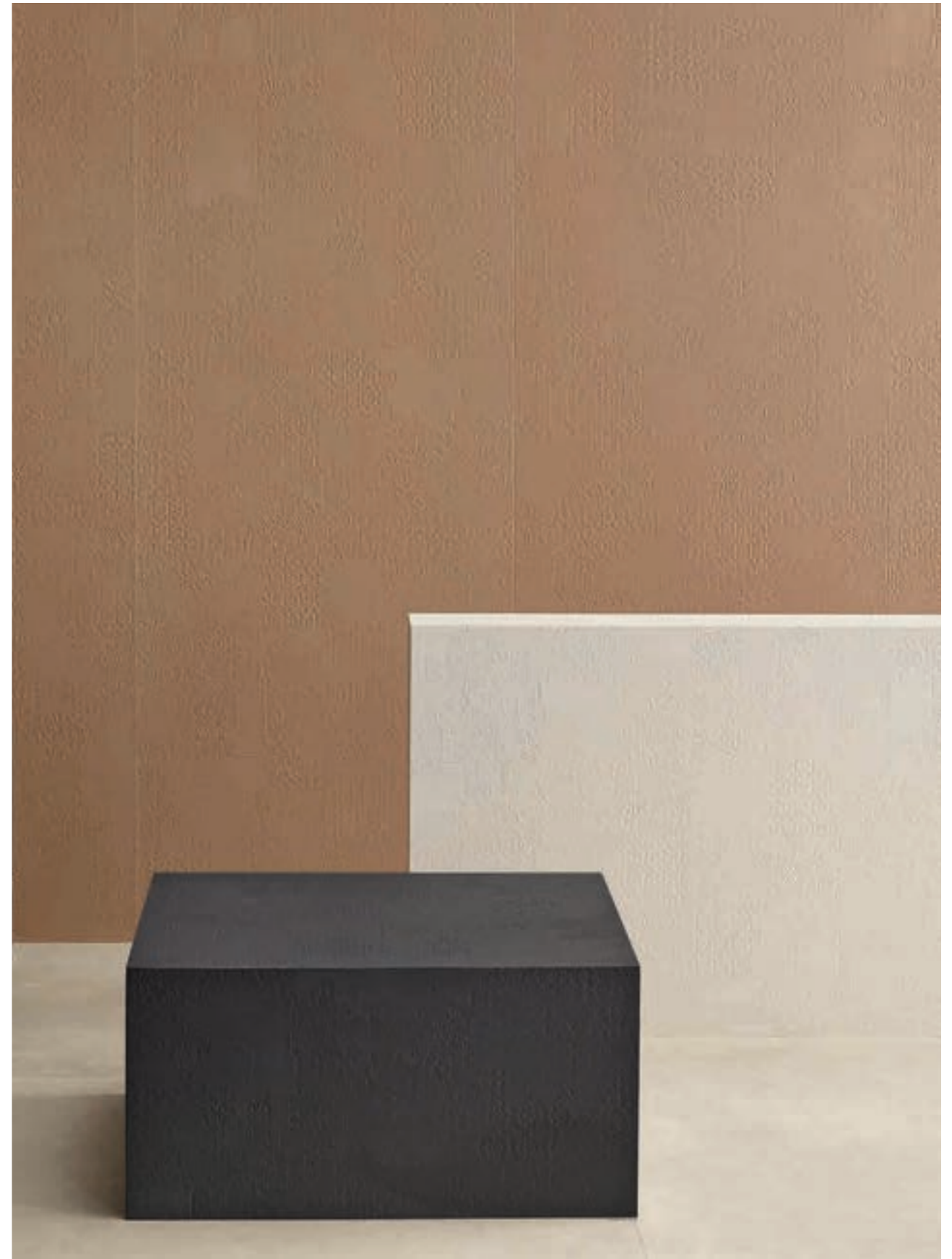
This page: Avana, Gesso, Grafite. Opposite page: Gesso.